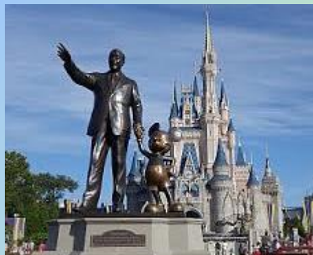
●ウォルト ディズニー ワールド