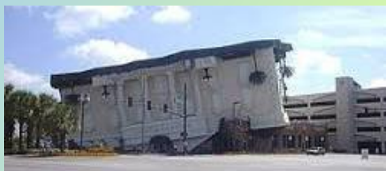
●ワンダーワークス