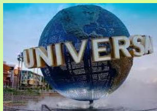
●ユニバーサル・オーランド・リゾート